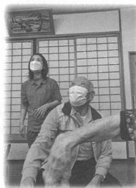
笑いすぎて泣いてます(笑)